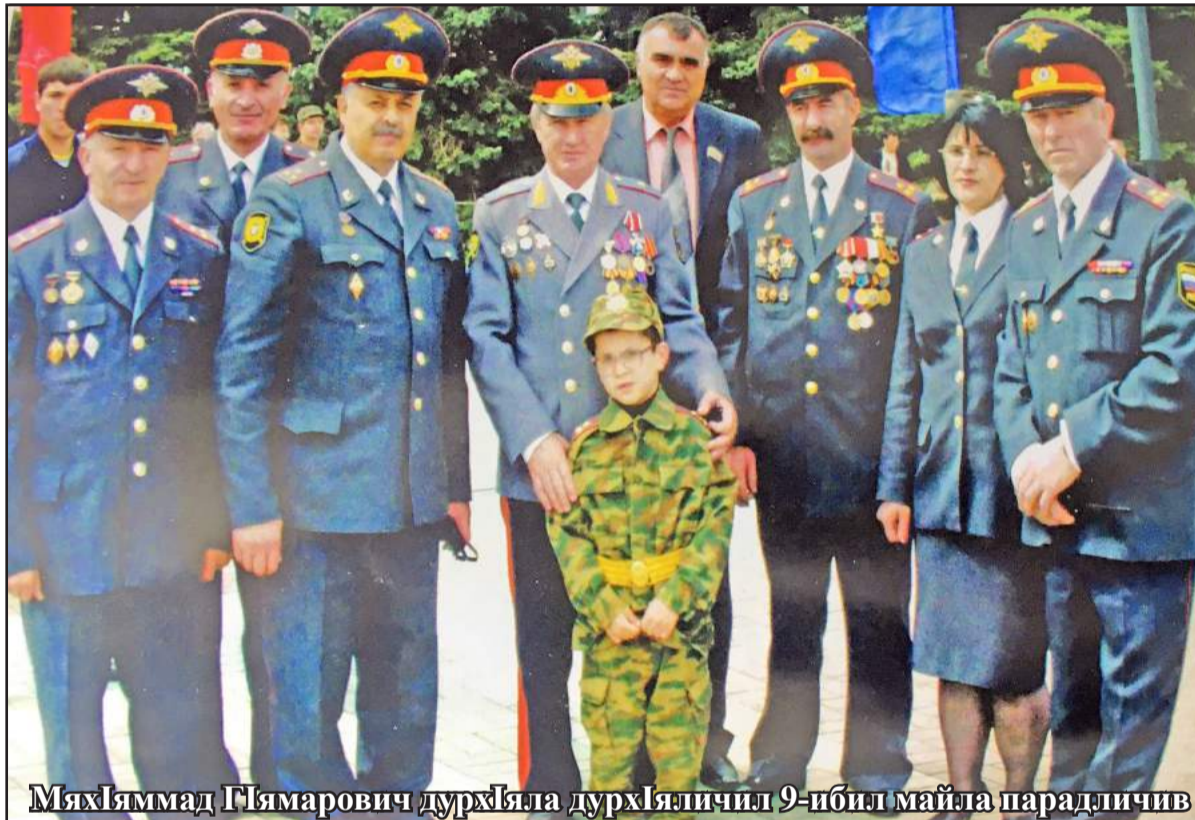
Мяхяммад Гямарович дурхIяла дурхIяличил 9-ибил майла парадличив

Низам-къяйда далтахъни-ла, такьсирчидешличил дяви бузахънила хIянчизартала чябхъинти дяхIяес – гъанкавцес хIебирули, къачагъуни, вайнукъяби дубурла районтази гъабулхъулри.